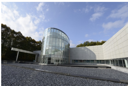
《テクノロジーセンター輝》

◆17:00~17:10頃 JR茅野駅にて解散 (交通事情により前後する場合がございます)