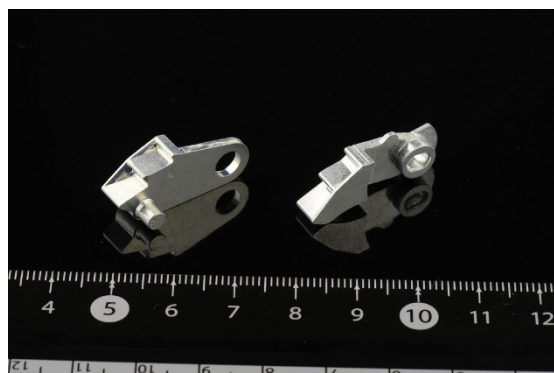
《自動車重要保安部品》