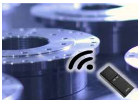
全ての加工部品にIoTを駆使