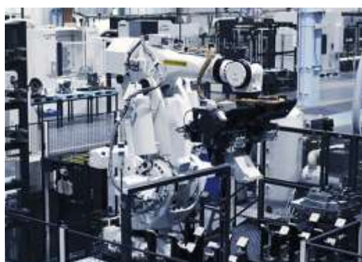
ロボットを高度に活用したDS2部品工場