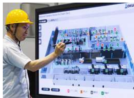
設備の稼働状況の見える化