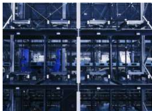
多品種少量生産を行う工場