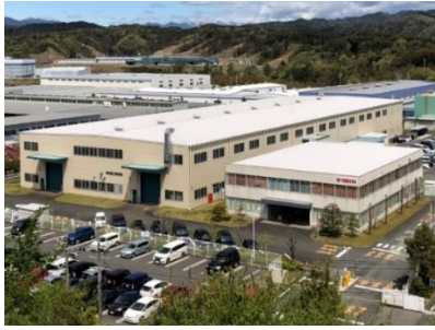
豊岡技術センター2、3号館