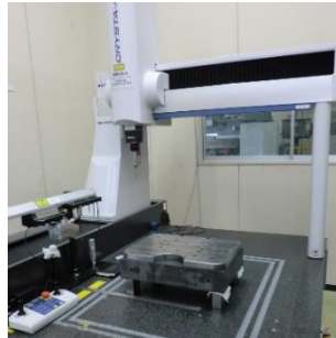
加工品の測定を行う検査工程