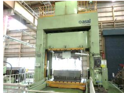
最終調整を行うDSP工程