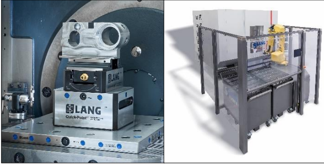
LANG社マクログリッパとワーク交換システム(ロボットレックス)