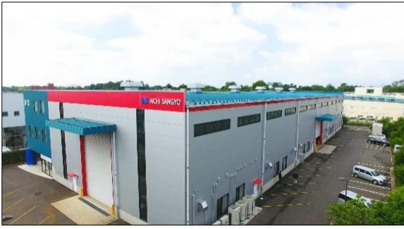
相模原事業所は大型システムの組立・試運転も可能