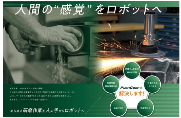
PUSHCORP社の次世代放り制御装置