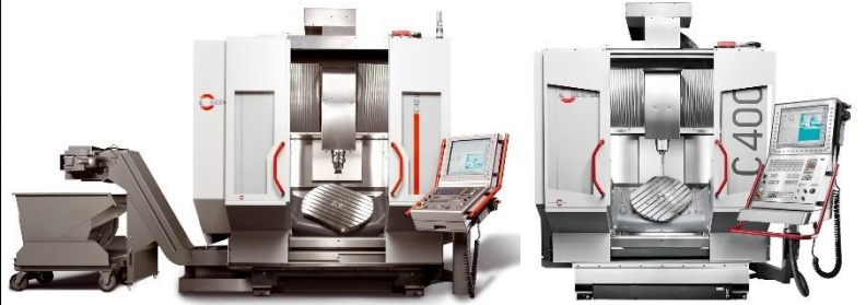
独自の設計思想により開発された5軸マシニングセンタ (HERMLE社 C42U、C400U)