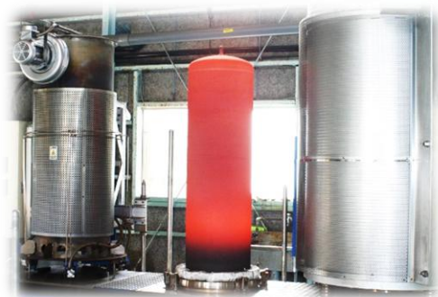
CVDコーティング装置